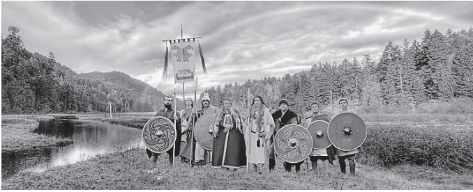
Im Alamannenmuseum findet am Internationalen Museumstag ab 11 Uhr wieder ein buntes Familienprogramm statt, mit dabei ist die Alamannengruppe „Adalar-Sippe“, aus der Schweiz.