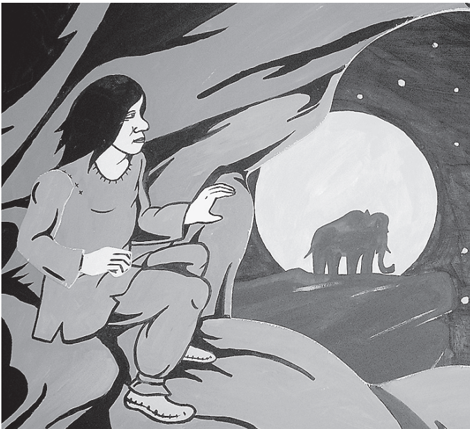
Das Figurentheater „Das kleine Mammut und Anju der Eiszeitjäger“ wird um 13.30 Uhr und 15.30 aufgeführt.